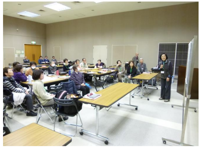
テーマ:「花と緑のまちづくりを提案する」