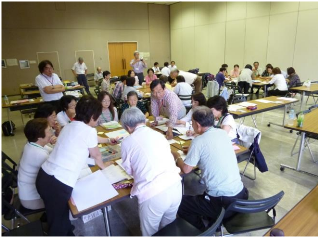
テーマ:「川崎の花と緑を知る」 グループ討議