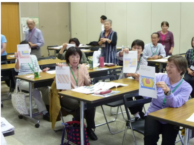
テーマ:「花壇デザインを考える」 デザイン実習