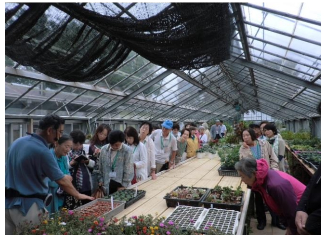
テーマ:「花と緑の基礎知識」 植物について学ぶ