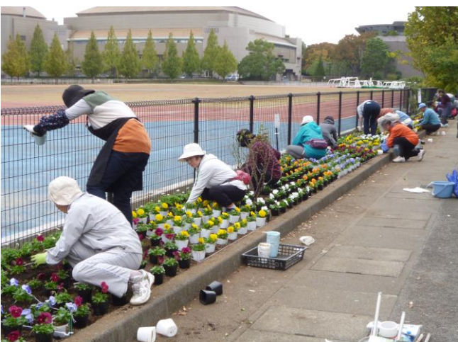
テーマ:「花壇を創る」 植え付け実習